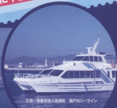
広島~宮島を結ぶ高速船 瀬戸内シーライン