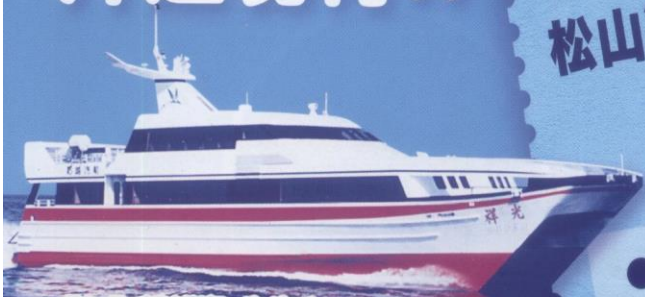
松山~呉~広島を結ぶスーパージェット

宮島・松山クルーズパス(片道キップ料金) 松山観光港~呉~広島(スーパージェット) + 広島~宮島(高速船)